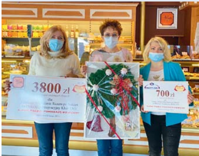
fol. Mat. organizatorów

WEJHEROWO | Już po raz dziewiąty w Tłusty Czwartek zorganizowano akcję charytatywną „Super Pączki pomagają dzieciom”. Symboliczny czek trafił do wejherowskiego Klubu Integracyjnego „TAO”.