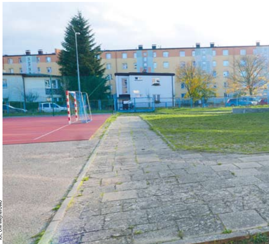
fol. UM Wejherowo

WEJHEROWO | Dwa nowe boiska powstaną w Wejherowie w ramach Budżetu Obywatelskiego.