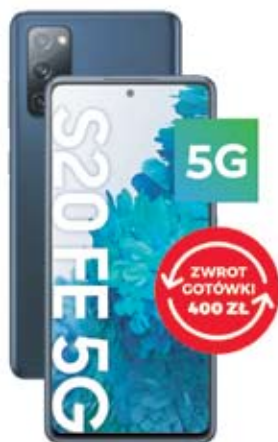
SAMSUNG Galaxy S20 FE 5G