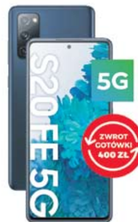
SAMSUNG Galaxy S20 FE 5G