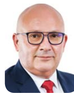
PIOTR WITTBRODT, WICEBURMISTRZ RUMI DS. SPOŁECZNYCH

pracowanych przez wszystkich zysków, nie od instytucji. Spółdzielnie socjalne mają też ogromne możliwości pozyskiwania dotacji np. ze środków unijnych. Ośrodek Wsparcia Ekonomii Społecznej Dobra Robota pozyskał blisko 3,4 miliona złotych na stworzenie miejsc pracy dla osób wykluczonych. Są to ogromne środki, które bez wsparcia Unii Europejskiej nie mogłyby trafić do metropolitalnych przedsiębiorstw społecznych. /afl/