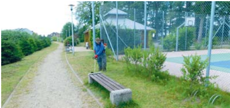
Prace porządkowe realizowane przez spółdzielnię na terenie Gminy Wejherowo.