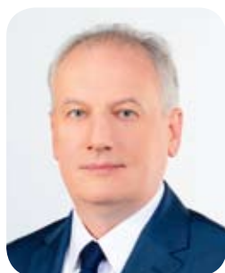
DARIUSZ DRELICH , WOJEWODA POMORSKI

zdecydowaliśmy o zmianie technologii wykonania tunelu z przecisku na wykop otwarty, jako rozwiązania bardziej bezpiecznego. Spowodowało to wydłużenie terminu realizacji o rok z uwagi na konieczność opracowania i uzgodnienia z PKP zmiennego projektu, a przede wszystkim opracowania regulaminu prac torowych i regulaminu prowadzenia ruchu pociągów, co było szczególnie skomplikowane w sezonie wakacyjnym. Dużo wolniejsza była realizacja, gdyż tory były wyłączane z ruchu etapami i tylko w określonych godzinach, aby umożliwić w tym czasie roboty budowlane w wykopach na torowisku.