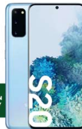
SAMSUNG Galaxy S20

75 zł miesięcznie, po rabacie za e-fakturę 10 zł