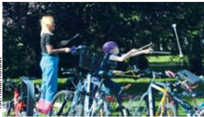
fol. Rafał Korbut

W gronie ponad 180 polskich miast, które uczestniczą w przedsięwzięciu, znalazła się m.in. Rumia. Z myślą o mieszkańcach tutejszy urząd przygotował szereg atrakcji. Hasło tegorocznej edycji brzmi „Zeroemisyjna mobilność dla każdego”.