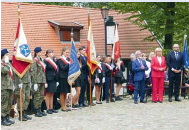
fol. UM Wejherowo

WEJHEROWO | Na Kalwarii Wejherowskiej obchodzony był w miniony weekend odpust Podwyższenia Krzyża Świętego.