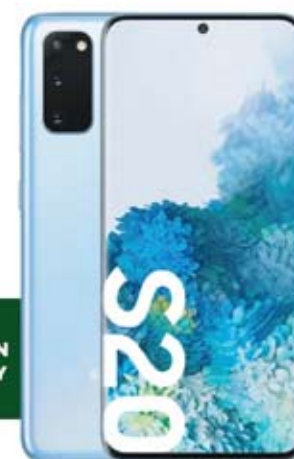
SAMSUNG Galaxy S20