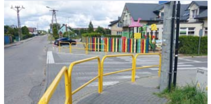
Przebudowa skrzyżowania Długiej z Orzechową w Bolszewie została ukończona i oddana do użytku. Udało się to zrobić wcześniej, niż planowano – przed ustalonym terminem wykonania.

GM. WEJHEROWO | Zakończyła się inwestycja drogowa, polegająca na modernizacji skrzyżowania.