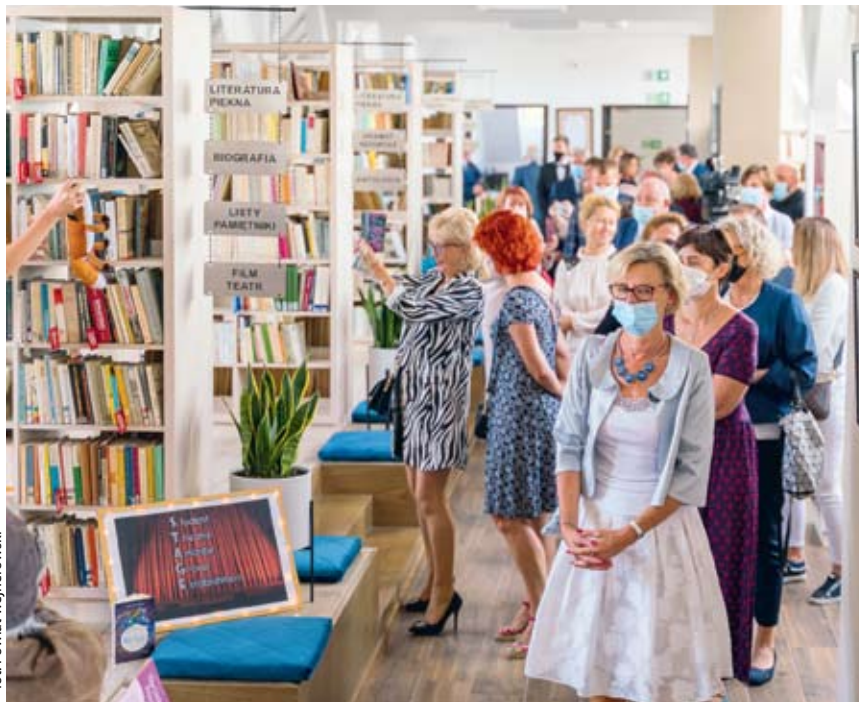
Uroczystość otwarcia biblioteki i pracowni w Rumi. Powiat wejherowski

Koszt obu inwestycji, w ramach których szkoła już wcześniej została także rozbudo-