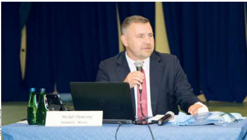
Uroczystość wręczenia absolutorium burmistrzowi Michałowi Pasiecznemu. UM Rumia

RUMIA | Podczas ostatnich obrad rada miejska udzieliła burmistrzowi Michałowi Pasiecznemu absolutorium – 12 radnych było za, 5 wstrzymało się od głosu, a 1 był przeciw.