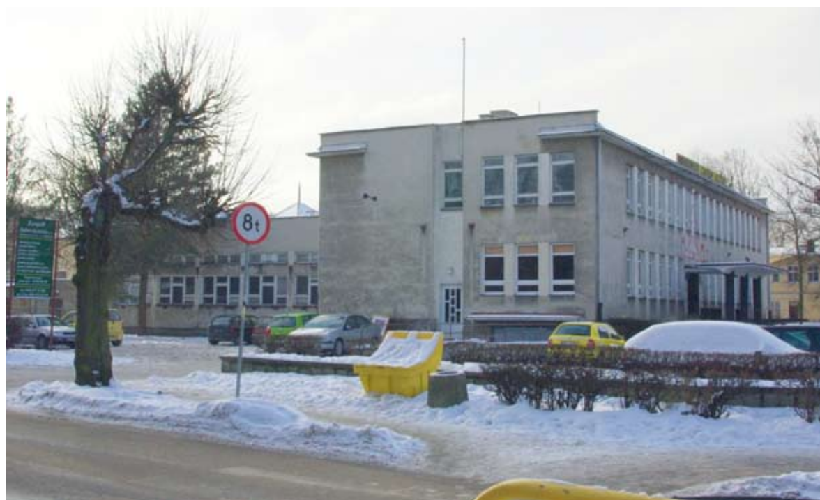
WCK 30 LAT TEMU

Zdjęcia cyfrowe (stare - można zeskanować lub sfotografować lustrzanką lub smartfonem - chodzi o ostrość i dobrą jakość) należy nadsyłać na adres foto@wejherowo.pl w terminie do 25 maja 2020 r. W miarę możliwości warto podać rok wykonania zdjęcia. Dla osób, które nadeślą zdjęcia przewidziane są nagrody niespodzianki. Na życzenie autora zdjęć w publikowanej galerii lub wydawnictwie zamiast imienia i nazwiska - w celu ochrony danych osobowych, można zamieścić