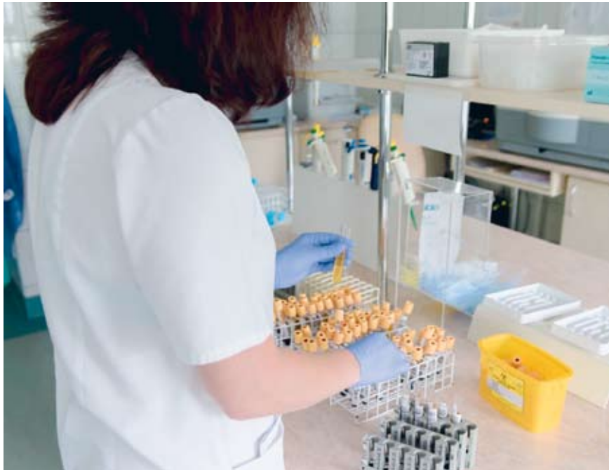
Laboratoria powstaną w Kościerzynie, Wejherowie i w Słupsku, tym samym wspierając dwa laboratoria działające już w Gdańsku. Czas oczekiwania na wyniki badań na obec-

WEJHEROWO | Kilka dni temu marszałek Mieczysław Struk podjął decyzję o pilnym zakupie sprzętu i uruchomieniu trzech laboratoriów do wykrywania koronawirusa.