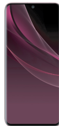
SAMSUNG Galaxy S20