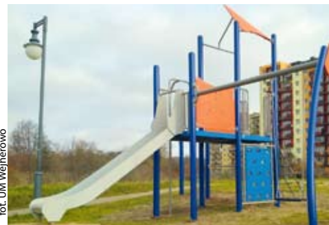
fot. UM Wejherowo

WEJHEROWO | Pięć placów zabaw w różnych częściach Wejherowa zostało niedawno doposażonych w nowe urządzenia. Z budżetu miasta przeznaczono na ten cel ponad 73 tysiące złotych.