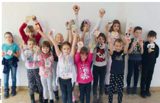
fol. UM Reda

REDA | Dobiegły końca ferie zimowe. Brak śniegu nie przeszkodził uczniom w aktywnym wypoczynku.