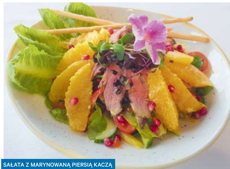
SAŁATA Z MARYNOWANĄ PIERSIĄ KACZA