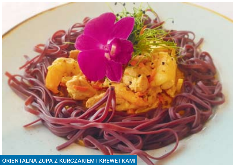
ORIENTALNA ZUPA Z KURCZAKIEM I KREWETKAMI