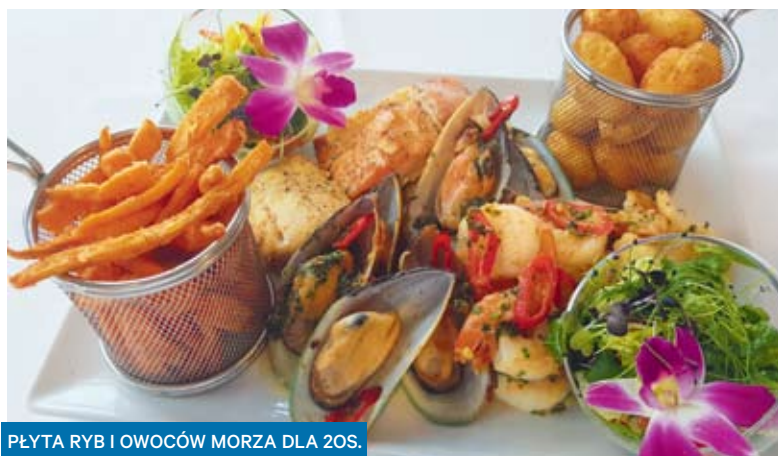
PŁYTA RYB I OWOCÓW MORZA DLA 2OS.

Wyjątkowe potrawy, których na próżno szukać w innych restauracjach, smaczne, zdrowe, przygotowywane wyłącznie ze świeżych produktów i do tego udekorowane np. jadalnymi kwiatami. Brzmi niemal jak kulinarny raj? Okazuje się, że jest on dostępny na wyciągnięcie ręki!