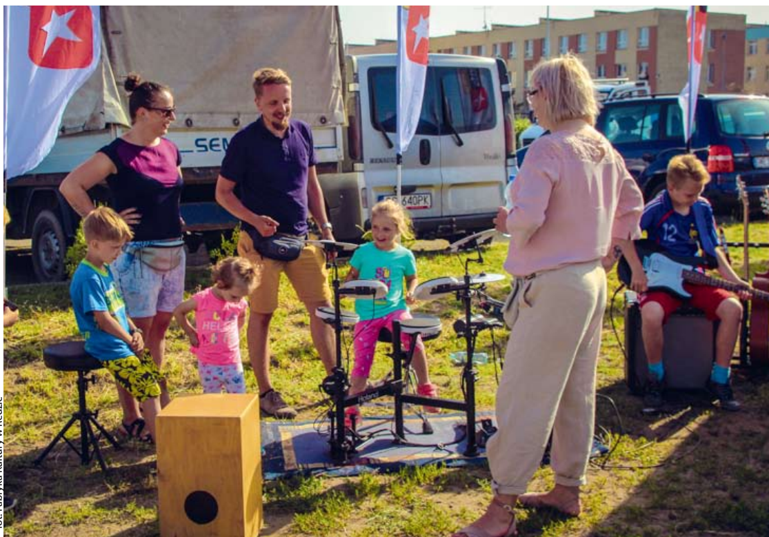
fol. Fabryka Kultury w Redzie