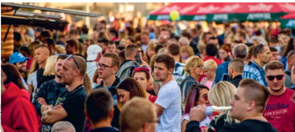
fol. Mat. pras.

WEJHEROWO | Najbliższy czerwcowy weekend będzie pełen smaków – rusza III Festiwal Smaków Food Trucków.