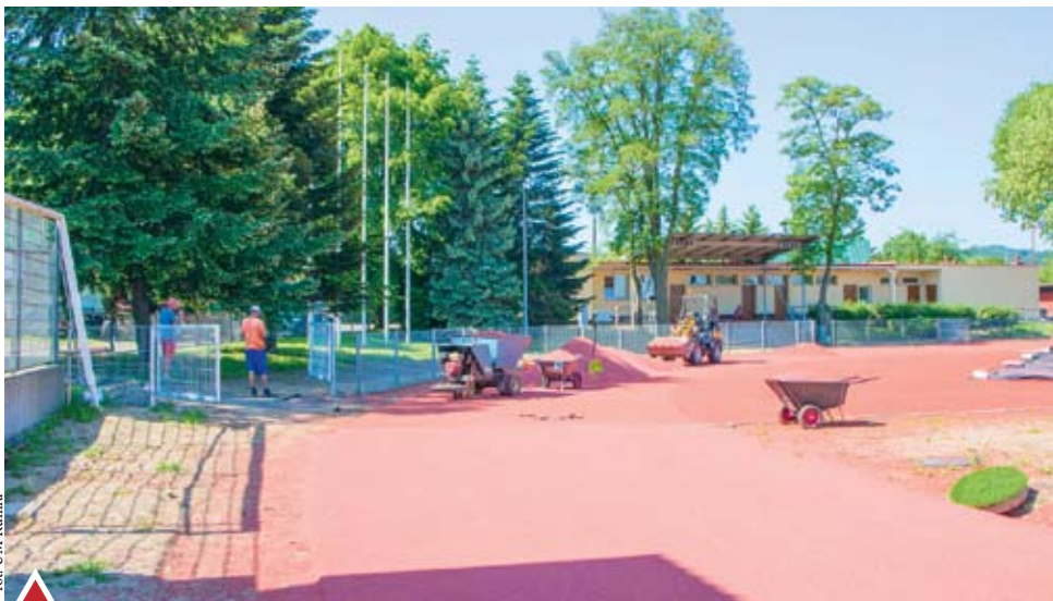
Przebudowa bieżni lekkoatletycznej na stadionie MOSiR

Obecnie układana jest nawierzchnia tartanowa na bieżniach wokół płyty boiska oraz na zakolach przeznaczonych m.in. do skoków w dal, rzutu oszczepem oraz pchnięcia kulą. Montowane jest również oświetlenie stadionu. Po ułożeniu nawierzchni bieżni, na boisku piłkarskim położona zostanie trawa darniowa oraz zainstalowane zostaną bramki piłkarskie. Inwestycja jest realizowana ze środków zewnętrznych.