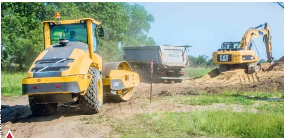
Budowa ul. Kazimierskiej

Obecnie układana jest nawierzchnia tartanowa na bieżniach wokół płyty boiska oraz na zakolach przeznaczonych m.in. do skoków w dal, rzutu oszczepem oraz pchnięcia kulą. Montowane jest również oświetlenie stadionu. Po ułożeniu nawierzchni bieżni, na boisku piłkarskim położona zostanie trawa darniowa oraz zainstalowane zostaną bramki piłkarskie. Inwestycja jest realizowana ze środków zewnętrznych.