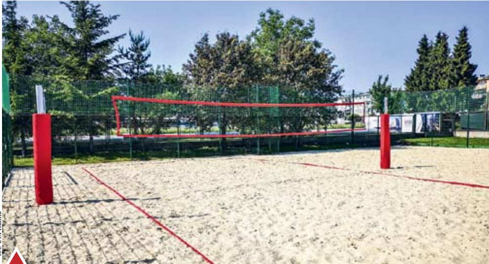
Budowa zespołu boisk do siatkówki plażowej oraz trybun przy Zespole Szkół Ogólnokształcących

RUMIA | Miasto realizuje kolejne inwestycje. Szczegółowe informacje dotyczące poszczególnych przedsięwzięć można znaleźć w poniższym zestawieniu.