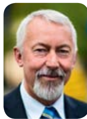
KRYSZTOF HILDEBRANDT, prezydent Wejherowa

Cieszymy się, że została podpisana umowa na budowę kolejnego odcinka bardzo dużego przedsięwzięcia - Zachodnio-Północnego Połączenia Drogowego, który docelowo odciąży ruch w Wejherowie w momencie, kiedy powstanie nowa Trasa Kaszubska, która jest fragmentem drogi ekspresowej łączącej Trójmiasto ze Szczecinem. Oddaliśmy już do użytku dwa odcinki ulic