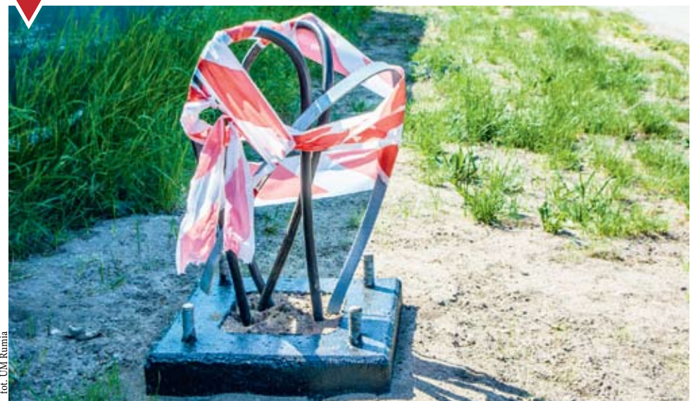
Budowa chodnika na ul. Obrońców Westerplatte i Kilińskiego

Położone zostały już fundamenty oraz okablowanie. Wkrótce rozpocznie się montaż słupów oświetleniowych. Jeszcze w tym roku lamp ulicznych przybędzie też m.in. na ul. Dębogórskiej oraz Towarowej. Łączny koszt tych inwestycji to około 400 tysięcy złotych.