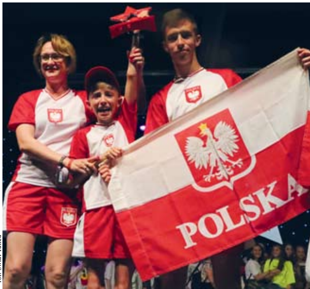
fol. Świat Tańca

WEJHEROWO | Drugie i trzecie miejsce, zdobyte przez wejherowskich tancerzy na mistrzostwach świata, to ogromny sukces. Same mistrzostwa dla zawodników były czasem sporego wysiłku oraz ogromnych emocji.