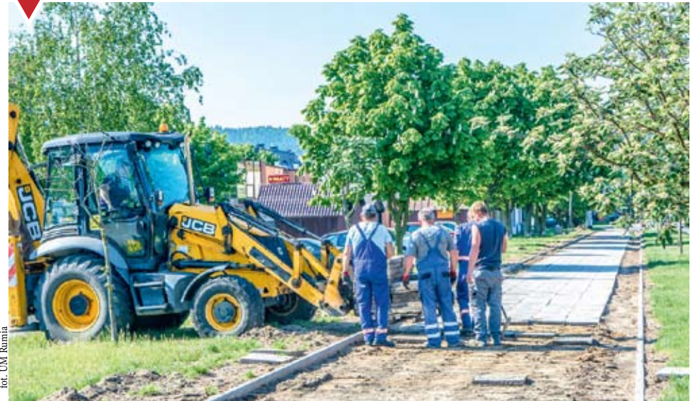
Oświetlenie na ul. Klonowej

Postępują prace budowlane, które mają się zakończyć jeszcze w czerwcu. Inwestycja jest realizowana w ramach Budżetu Obywatelskiego.