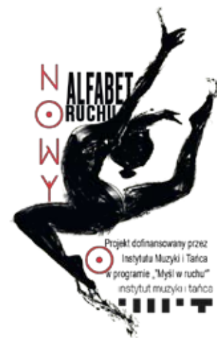
Projekt dofinansowany przez Instytut Muzyki i Tańca w programie „Myśli w ruchu” Instytut muzyki i tańca

czość Piny, międzynarodowej sławy choreografki. Za aranżację muzyczną podczas przedstawienia odpowiadać ma Prywatna Szkoła Muzyczna w Redzie. Anna Walk