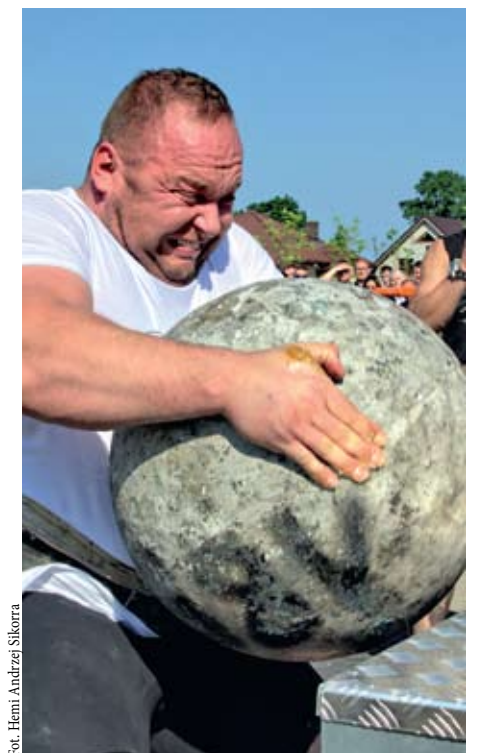
Fot. Hemi Andrzej Sikorra