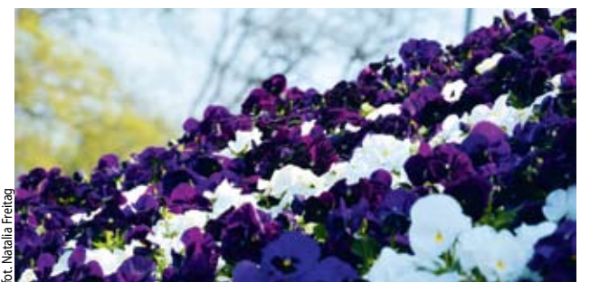
Fot. Natalia Freitag