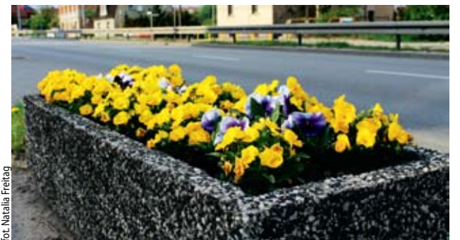
Fot. Natalia Freitag