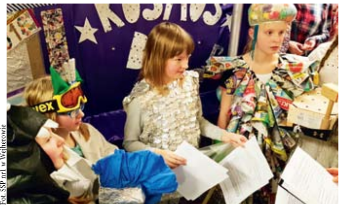
Fot. SSP nr1 w Wejherowie

Odyseusze współzawodniczą ze sobą w czterech grupach wiekowych. Drużyny, które w poszczególnych kategoriach uzyskują najlepsze wyniki na Eliminacjach Regionalnych, awansują do Finału Ogólnopolskiego. Jego laureaci mogą z kolei reprezentować Polskę na Finałach Euro-