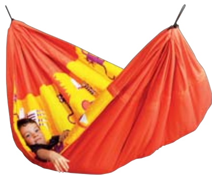
HAMAK DLA DZIECI ANIMUNDO bonami.pl