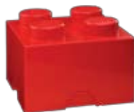
CZERWONY POJEMNIK KWADRATOWY LEGO bonami.pl