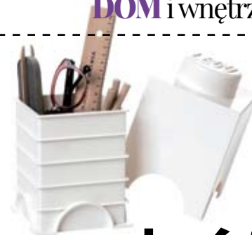
BIAŁE PUDELKO LEGO bonami.pl