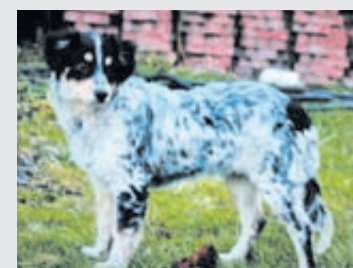
ODDAM fajnego psa kundelka w dobre ręce, Rumia, tel. 690 513 819

ZŁOTA rączka, drobne naprawy, sprzątanie obejścia, piwnic, transport, prace w ogrodzie, okolice Luzina, Wejherowo, tel. 693 737 381