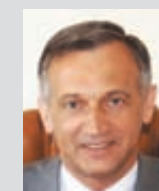
KRZYSZTOF KRZEMIŃSKI, burmistrz Redy:

- Reda ma coraz więcej mieszkańców, tym samym coraz więcej dzieci. Mała sala gimnastyczna ułatwi wszystkim dzieciom z klas 1-3 (a tych klas jest u nas 12) i zerówki uczestniczenie w zajęciach wychowania fizycznego w przyzwyczajonych warunkach, na odpowiedniej powierzchni. Nie jest to może rozwiązanie idealne, ale z pewnością znacznie poprawiło dotychczasową sytuację. Czy będzie potrzebna dalsza rozbudowa, kolejne inwestycje? Trudno powiedzieć, bo zależy to od tego, jak szybko będzie rosła liczba dzieci uczęszczających do szkoły podstawowej.