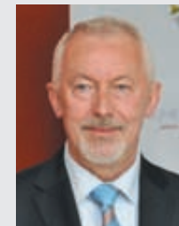
KRZYSZTOF HILDEBRANDT , prezydent Wejherowa:

- W tym roku obchodzimy 25-lecie samorządów – podkreśliła starosta Lisius. - Ideą samorządów było społeczeństwo obywatelskie. W Wejherowie widzimy, że ta idea funkcjonuje. Pierwszy budżet obywatelski okazał się świetnym pomysłem i wierzę, że ten pomysł będzie podtrzymywany i realizowany w kolejnych latach. O że środki na inicjatywy lokalne będą coraz większe.