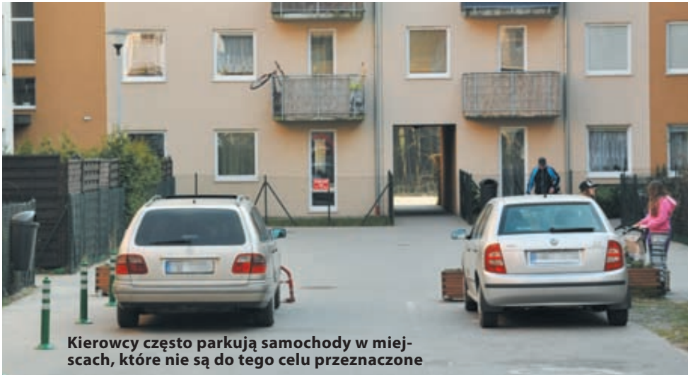
Kierowcy często parkują samochody w miejscach, które nie są do tego celu przeznaczone

WEJHEROWO | Problem z parkowaniem na osiedlu Fenikowskiego, który poruszyliśmy na łamach naszej gazety, odbił się szerokim echem. Głos w tej sprawie zabrał prezes firmy Orlex.