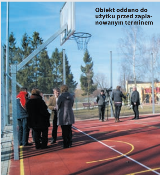
Obiekt oddano do użytku przed zaplanowanym terminem

GM. WEJHEROWO | Wybudowana niemal 3 miesiące przed terminem, cieszyć będzie wszystkich mieszkańców Nowego Dworu Wejherowskiego. Mowa o strefie rekreacyjno-sportowej, która właśnie została oddana do użytku.