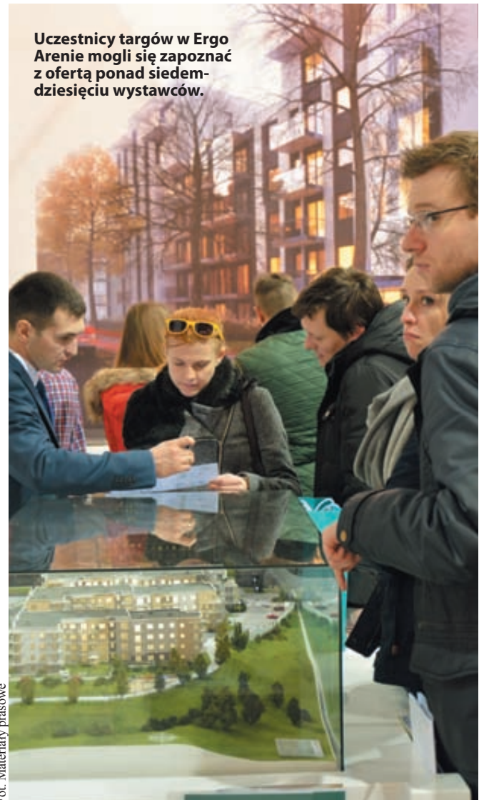
Uczestnicy targów w Ergo Arenie mogli się zapoznać z ofertą ponad siedemdziesięciu wystawców.

Pierwsza edycja Targów Nowy DOM Nowe MIESZKANIE w Gdańsku zgromadziła ponad siedemdziesięciu Wystawców. Targi poświęcone były kompleksowej prezentacji oferty mieszkań tak na rynku pierwotnym jak i wtórnym w rejonie Trójmiasta i okolic. Ofertę targową wzbogaciła prezentacja firm doradczych. Nie zabrakło nowości oraz niestandardowej oferty rynku. (PR)