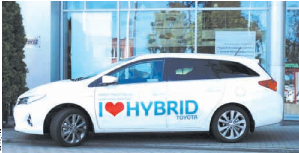
Hybrydowy Tydzień rozpoczyna się już w najbliższy poniedziałek

Pełną gamę hybrydowych Toyot będzie można zobaczyć także 25 lutego o godzinie 18.00. na Ergo Arenie w trakcie meczu PGE Atom Trefl Sopot – MKS Banimex Dąbrowa Górnicza. Toyota Walder przygotowuje specjalną ekspozycję oraz wiele atrakcji, m.in. konkurs, w którym będzie można wy-