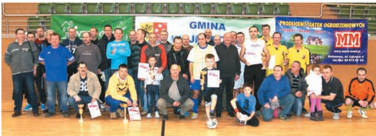
Po raz pierwszy w turnieju udział wzięła drużyna oldbojów z Gniewina

GM. WEJHEROWO | Już po raz 7 w hali widowiskowo – sportowej w Bolszewie na turnieju z okazji 95 Rocznicy Zaślubin Polski z Morzem spotkały się drużyny piłkarskie oldbojów z naszego regionu. Tradycyjnie, na piłkarskim boisku, uczcili to historyczne wydarzenie.