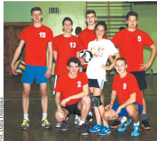
Zespół Olimp Bolszewo

REDA | W hali Zespołu Szkół nr 1 w Redzie odbyły się rozgrywki Redzkiej Ligi Siatkówki. W zmaganiach udział wzięło osiem drużyn, które podzielone zostały na dwie grupy. W wyniku rozgrywek w grupie A zwyciężyły Śledzie, uzyskując 6 pkt. Drugie miejsce zajęli Czadomeni z 4 pkt, trzecie miejsce Black Team z 2 pkt i czwarte miejsce Ekpa Tomka z 0 pkt. Natomiast w grupie B wygrała Hawana, zdobywając 6 pkt. Drugie miejsce zdobył Olimp Bolszewo z 4 pkt, trzecie miejsce Som Lepsi z 2 pkt i czwarte miejsce Sami Swoi z 0 pkt. W meczach finałowych o trzecie miejsce Bolszewo wygrało z Czadomeni 2:1. W meczu o pierwsze miejsce Śledzie pokonały Hawanę 2:0. W składzie zwycięskiej drużyny Śledzi zagraли: Artur Miotk, Rafał Miotk, Adam Kloka, Cezary Madziąg, Ewa Dudek i Miłosz Gdanietz. (DD)