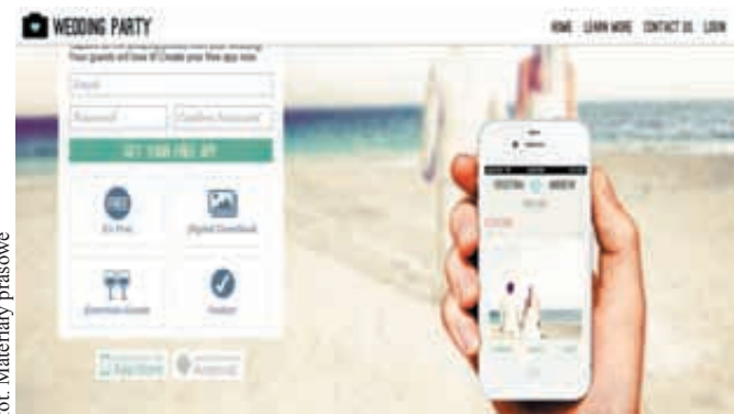
fol. Materiały prasowe