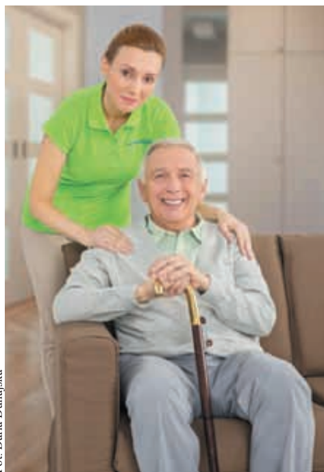
Osoby obłożnie chore, będące pod opieką rodziny, będą miały dodatkowe wsparcie

„Teleopieka zapewni mieszkańcom gminy bezpłatny dostęp do telefonicznej opieki domowej, polegającej na elektronicznym całodobowym monitoringu i przyzywaniu natychmiastowej pomocy w