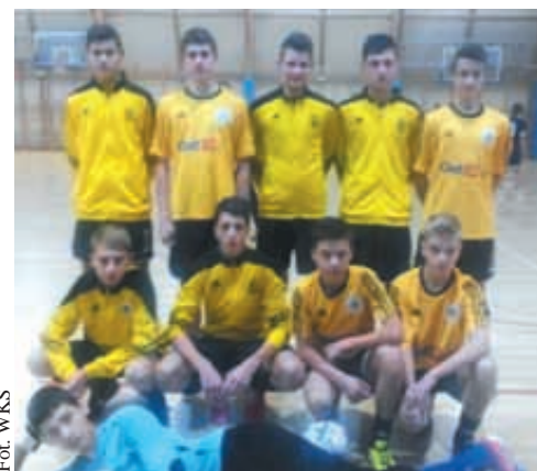
W rozgrywkach finałowych AP Brda Bydgoszcz pokonała Gryf Wejherowo 2:0