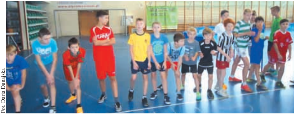
Fot. Daria Dunajska