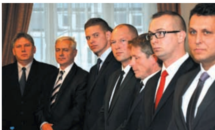
Po raz pierwszy od wielu lat radni wszystkich ugrupowań zagłosowali za przyjęciem budżetu

Po raz pierwszy od wielu lat wszyscy radni Wejherowa zagłosowali za przyjęciem budżetu w takim kształcie, jak zaproponował to prezydent miasta. Wprawdzie radni opozycji mieli kilka uwag krytycznych do projektu uchwały, ale – jak podkreślili – miał to być gest porozumienia i chęć dalszej współpracy.