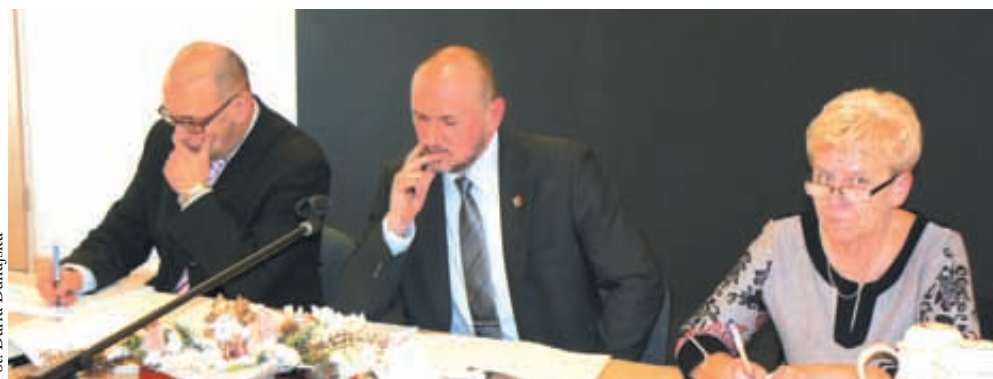
Radni gminy Wejherowo podjęli uchwałę budżetową

szewie, budowa chodnika w Kniewie i Zbychowie, budowa ciągu pieszo-rowerowego ul. Zamostnej w Bolszewie, budowa ul. Brzozowej w Gościcinie i Gowinie, budowa ul. Grubby w Gościcinie i Gowinie, budowa ul. Polnej w Bolszewie, ul. Południowej w Gościcinie, ul. Wodnej w Bolszewie, ul. Okrężnej w Bolszewie, budowa zatoki autobusowej w Łężycach, Orlu, rozbudowa ul. Długiej w Bolszewie i ul. Wejhera w Orlu, likwidacja barier wykluczenia cyfrowego, rozbudowa remiz w Gościcinie, Górze i Orlu, rozbudowa dyżurki SP Nowym Dworze Wejherowskim, budowa przyłącza gazowego SP Orle, budowa kanalizacji sanitarnej w Bolszewie, Gościcinie, Łężycach, Kapinie, kanalizacji deszczowej w Gowinie, ArtParku z budową strefy rekreacyjno-sportowej