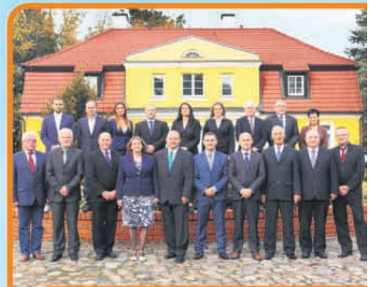
Nasi kandydaci do Rady Powiatu oraz Sejmiku Wojewódzkiego