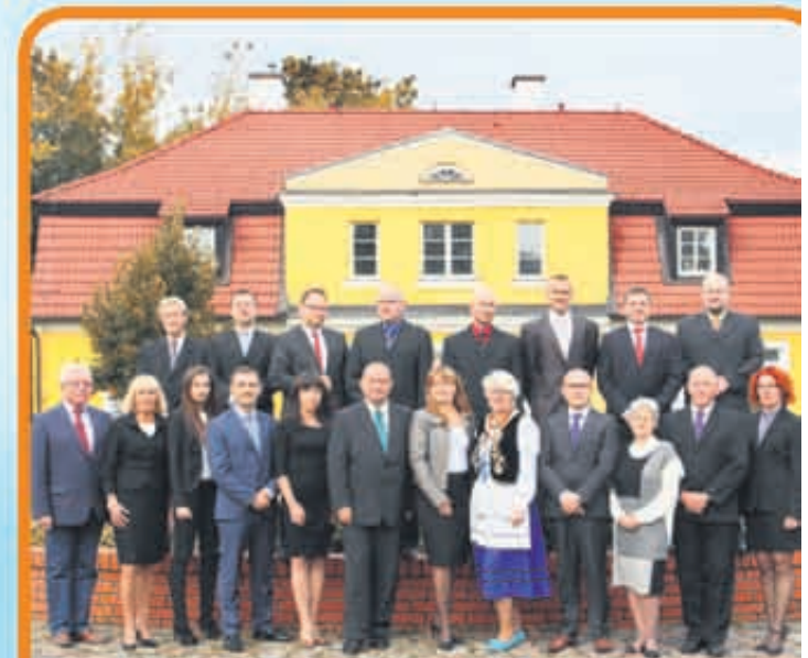
Kandydaci do Rady Miejskiej Rumi oraz Sejmiku Wojewódzkiego