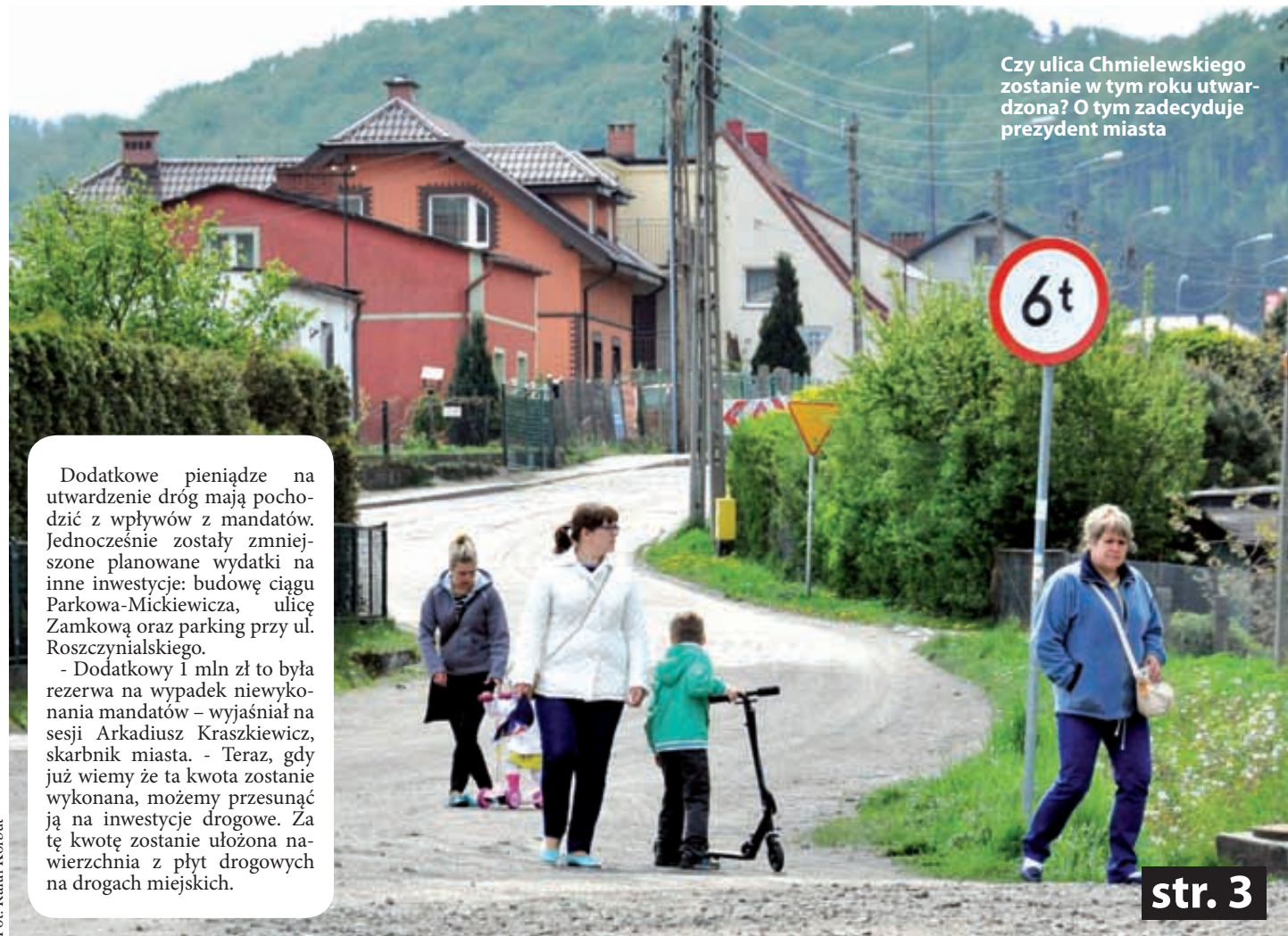
Czy ulica Chmielewskiego zostanie w tym roku utwardzona? O tym zadecyduje prezydent miasta

Dodatkowy milion złotych radni Wejherowa przeznaczyli na utwardzenie betonowymi płytami ulic gruntowych. Decyzja została jednogłośnie – aczkolwiek nie bez pewnych wątpliwości – podjęta na ostatniej (wtorkowej) sesji Rady Miasta Wejherowa.