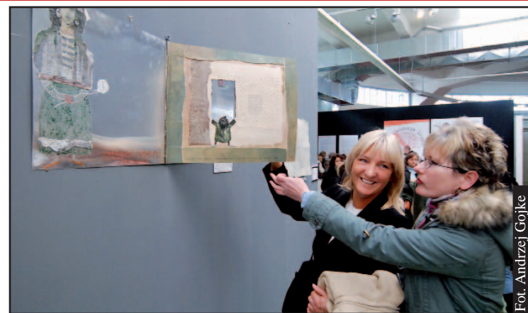
Wystawa sztuki książki „Czas” jest pokłosiem 8. Międzynarodowego Festiwalu Książki Artystycznej, który z każdym rokiem cieszy się coraz większym powodzeniem.

Obok wystawy sztuki książki „Czas” prezentowana jest również liBeratura, określana mia-