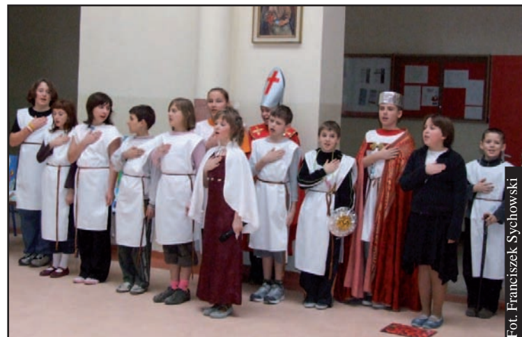
Przedstawienie przygotowała grupa ojca Dydaka.