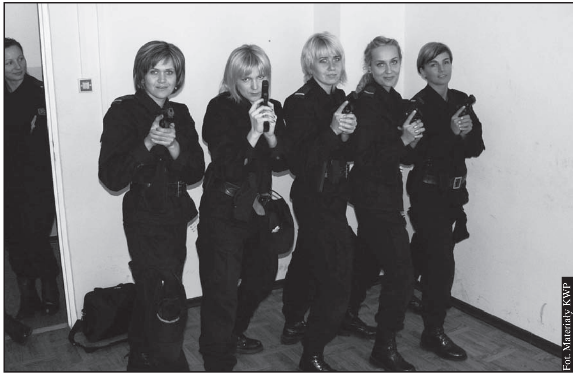
Płeć piękna nie jest wcale słabsza, a można by nawet rzec, że czasem wręcz przeciwnie.