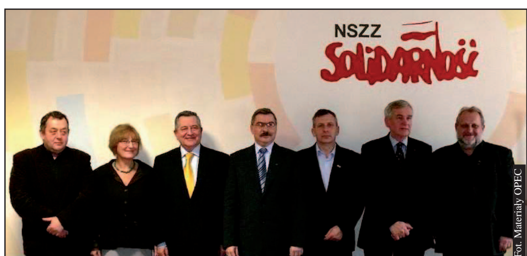
OPEC to firma przyjazna pracownikom.

Dnia 21 stycznia 2008 r. Prezydent RP Lech Kaczyński wręczył najlepszym firmom w Polsce certyfikaty „Pracodawca Przyjazny Pracownikom”. Jednym z laureatów ogólnopolskiej kampanii zostało Okręgowe Przedsiębiorstwo Energetyki Ciepłej Sp. z o.o. w Gdyni.