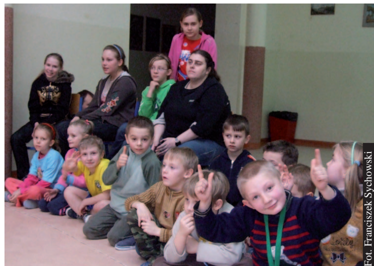
Na tegorocznych „Feriach z Jezusem” nikt się nie nudził.