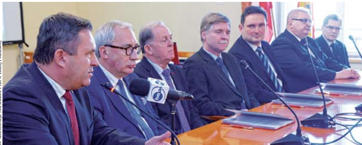
foto Konferencja Mieszkanie Plus w Białej Podlaskiej