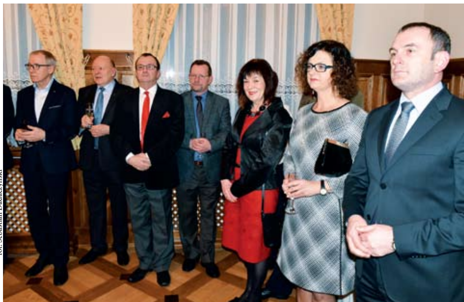
na uroczystości pojawili się przedstawiciele SKB - ZP oraz władze Starogardu

STAROGARD GD | Szykownie ubrani oficerowie, klimat II Rzeczypospolitej, liczni goście w pięknych salach. W Kasynie Oficerskim, stanowiącym muzeum w Starogardzie Gdańskim, zorganizowano noworoczne spotkanie członków, sympatyków i przyjaciół Szwadronu Kawalerii im. 2. Pułku Szwoleżerów Rokitniańskich, prowadzących powyższą placówkę.