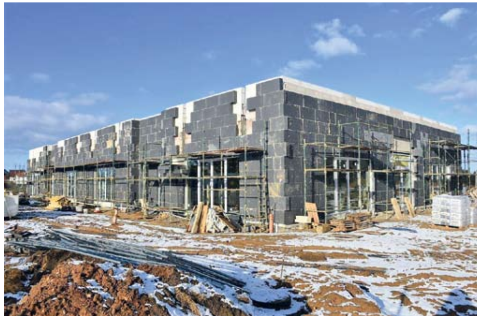
Budowa nowego przedszkola w Zblewie