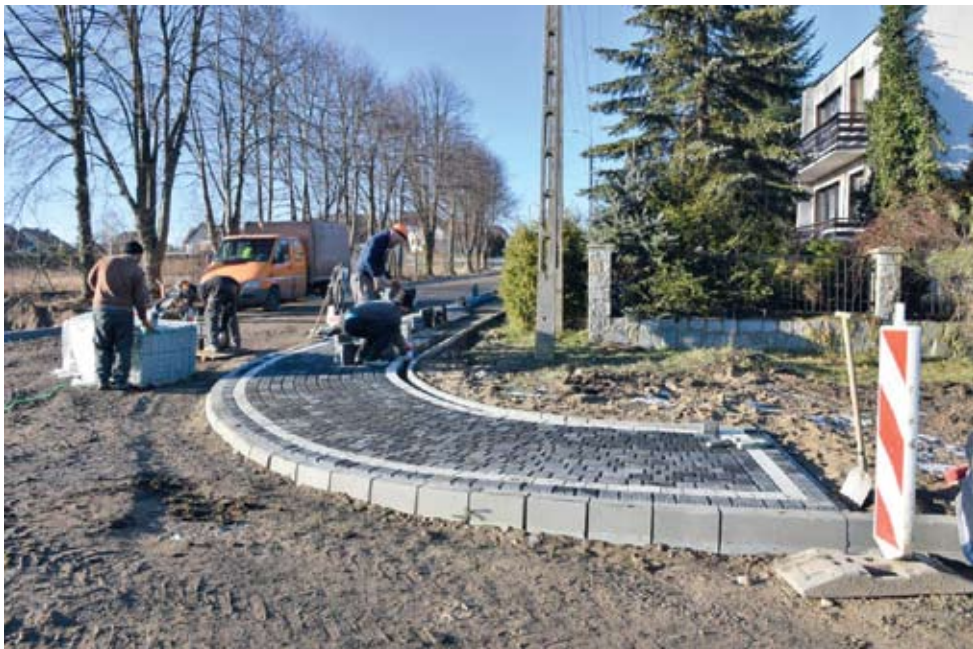
Kompleksowa modernizacja infrastruktury na osiedlu w Zblewie