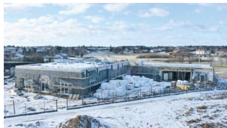
Nowe przedszkole w Zblewie będzie przestronne i nowoczesne, znajdzie tu miejsce 177 dzieci

Modernizacja oczyszczalni ścieków w Zblewie wraz z przebudową Stacji Uzdatniania Wody w Zblewie i w Jeziercach. Inwestycja w tym roku zostanie zakończona. Jest to zdecydowanie naj-