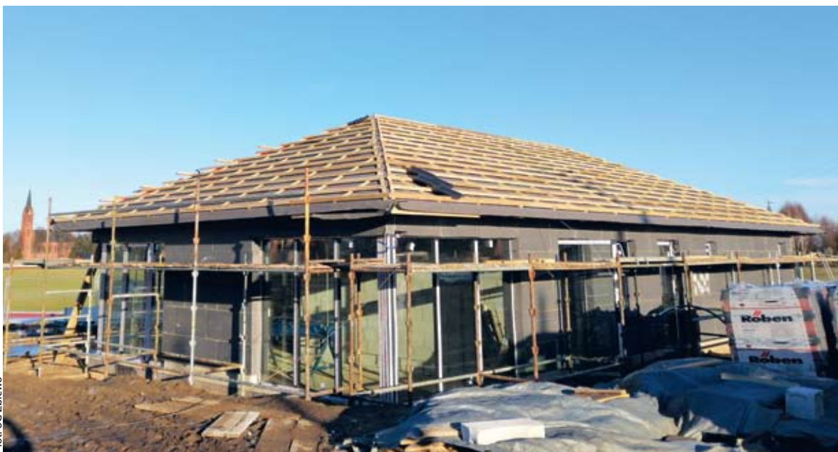
II etap modernizacji stadionu w Zblewie (budowa szatni)

GM. ZBLEWO | Dla Gminy Zblewo rok 2021 był, a rok 2022 będzie rekordowym pod względem wydatków na inwestycje. Jak szacuje wójt Artur Herold wyniosą one ok. 25 mln zł.