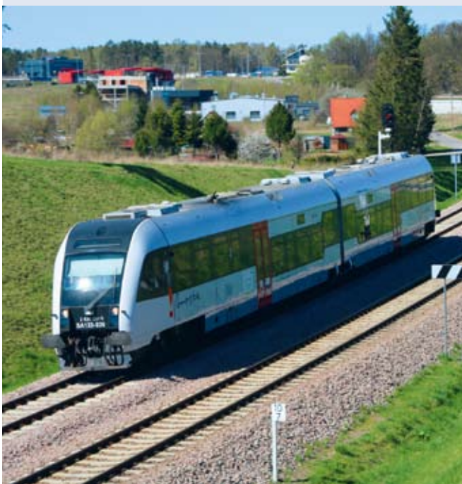
fol. Pomorska Kolej Metropolitalna

POMORZE | Ponad 48,8 mln zł będzie kosztować elektryfikacja linii Pomorskiej Kolei Metropolitalnej. Powstanie także nowy przystanek.