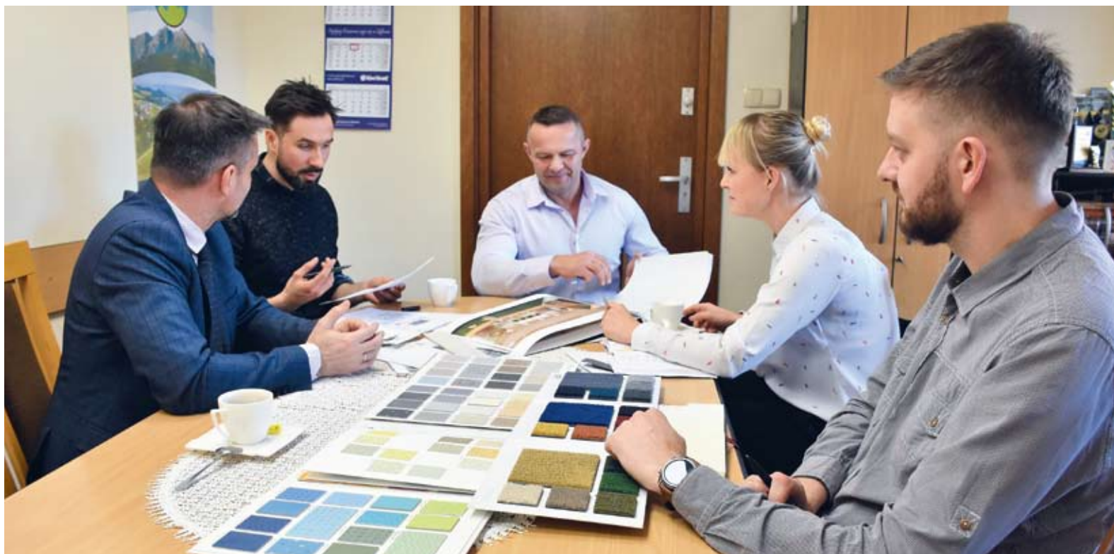
Prace nad projektem aranżacji są już na finiszu

Tymczasem są już na finiszu prace nad projektem aranżacji nowego przedszkola. Wójt Artur Herold dokłada starań, aby każdy szczegół został dopracowany i uzgod-