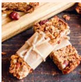
fol. mat. prasowe

Słodczyce w szkole to kontrowersyjny temat wśród rodziców, którzy często stają przed dylematem: pozwolić dziecku na coś słodkiego czy kategorycznie mu tego zakazać?