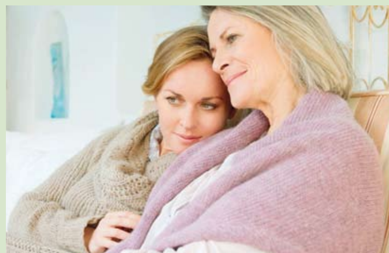
fol. mat. prasowe

W trosce o zdrowie i bezpieczeństwo Pań oraz personelu medycznego badania są wykonywane z zachowaniem wszelkich przewi-