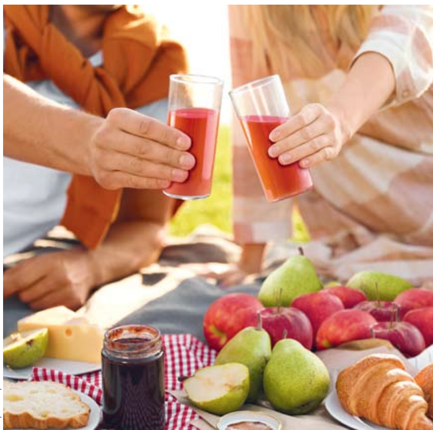
fol. mat. prasowe

Czerwone, żółte, a nawet brązowe. Pełne smaku i aromatu - takie są właśnie polskie pomidory. Chętnie sięgamy po nie jako dodatek do kanapek, sałatek, jako składnik zup i sosów.