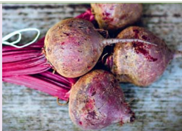
fol. mat. prasowe

Jaką gwarancję daje logo zielonego liścia widniejące na produktach eko? Produkcja żywności ekologicznej podlega ścisłym restrykcjom i kontrolom. Wybierając ją, mamy pewność pochodzenia i sposobu przetwarzania. Każdy produkt ze znakiem jakości eko musi mieć certyfikat poświadczający, że został otrzymany zgodnie z kryteriami produkcji ekologicznej. System kontroli obej-