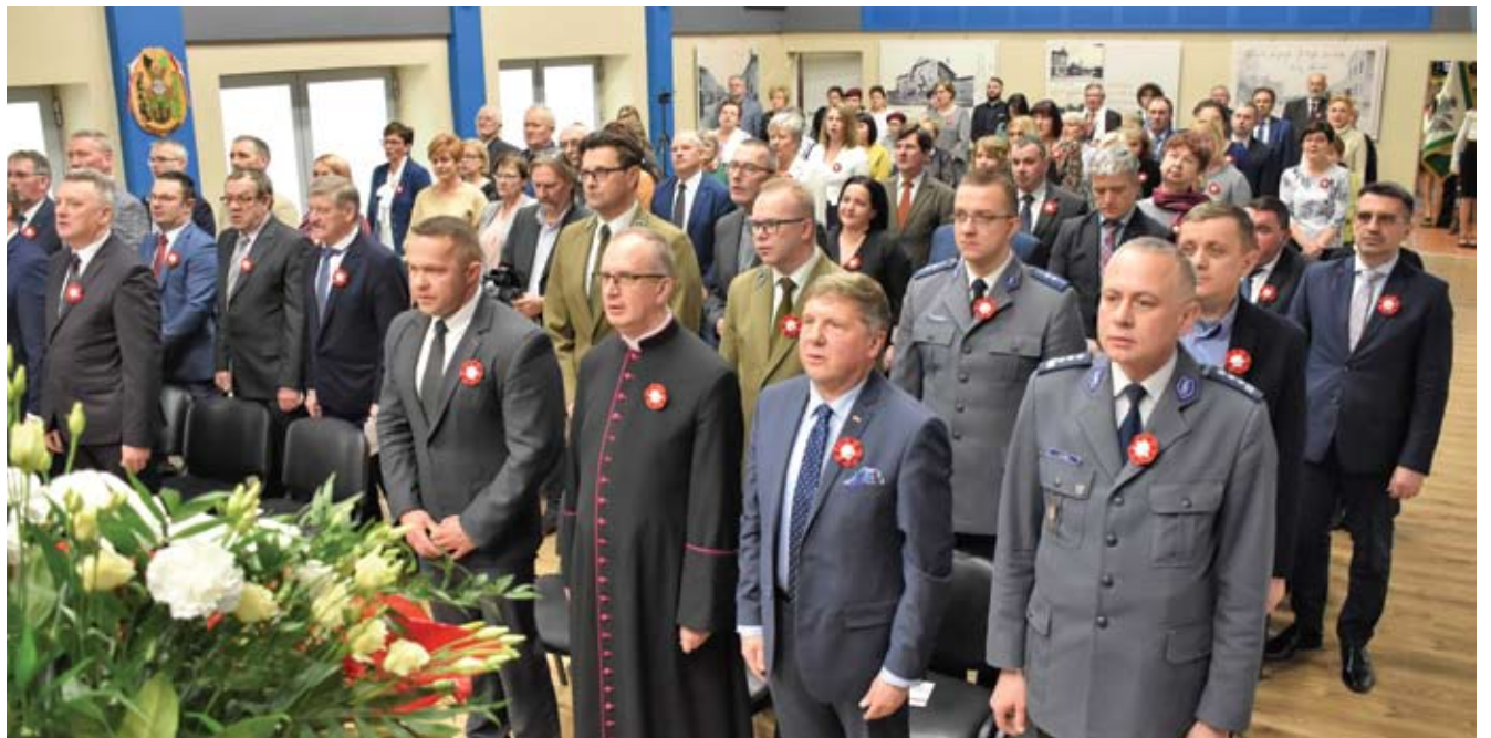
Zblewo w 100-lecie powrotu Pomorza do Macierzy

A kilka dni później tj. w środę – 29 stycznia – zorganizowano uroczystą sesję Rady Gminy Zblewo. Wzięło w niej udział - oprócz radnych – także liczne grono Mieszkańców i zaproszonych gości. Podczas sesji, na wniosek Wójta Gminy Zblewo zostały pośmiertnie nadane tytuły „Zasłużony dla Gminy Zblewo”. Otrzymały je cztery osoby, które – jak