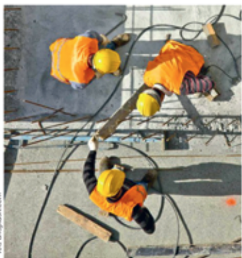
Od pół roku stopa bezrobocia na Pomorzu jest bardzo niska, a obecnie 4,4 proc. to lepszy wynik niż średnia krajowa.

Najniższe w historii regionu bezrobocie rejestrowane po raz pierwszy odnotowano w czerwcu 2019 roku. Od tego czasu utrzymuje się na poziomie 4,4 proc., podczas gdy średnio w Polsce jest to 5,1 proc. To także mniej niż w listopadzie ubiegłego roku, kiedy bezrobocie wynosiło 4,8 proc. Lepiej niż w Pomorskiem jest tylko w czterech województwach: wielkopolskim (2,8 proc.), śląskim (3,6 proc.), małopolskim (4 proc.) i mazowieckim (4,3 proc.). Nieco wzrosła jednak liczba osób pozostających bez pracy oraz zmalała liczba wolnych stanowisk zgłaszanych do urzędów. W woje-