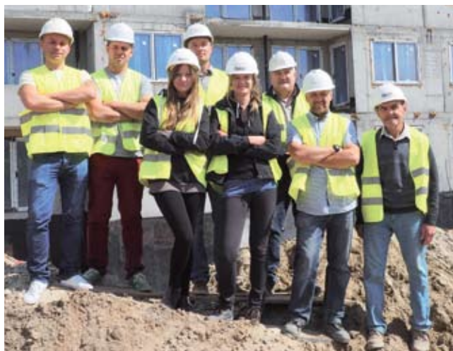
Dyrektor wraz z kadrą kierowniczą

Hartuna Sp. z o.o. dawniej F. U. H „Lemar”, która prowadzi kompleksową działalność usługowo-budowlaną w regionie pomorskim, dziś zatrudnia już 130 osób. Z roku na rok, dzięki szybkiemu rozwojowi przedsiębiorstwa, pracowników przybywało. Od początku istnienia firmy, czyli 2001 roku, jej właściciele stawiali na zatrudnianie fachowców. Dlatego obecnie pracują tam osoby reprezentujące przeróżne zawody: od pracowników administracji, gdzie cała kadra ma wykształcenie wyższe, poprzez inżynierów budownictwa, inżynierów z branży konstrukcyjno - budowlanej, inżynierów sanitarnych, pracowników budowlanych wszystkich branż: hydraulików, spawaczy, elektryków,