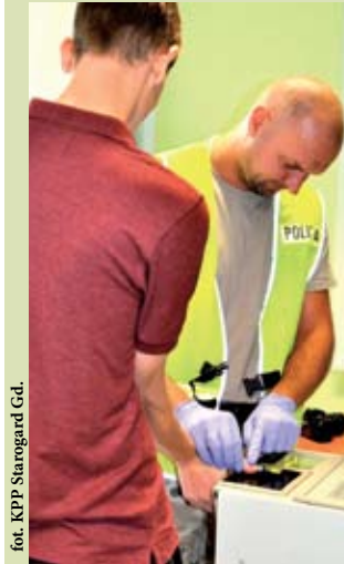
fol. KPP Starogard Gd.

STAROGARD GD. I Sceny niczym z filmu kryminalnego rozegrały się na ulicach Starogardu Gdańskiego. Policjanci zatrzymali w wyniku pościgu 27-latką, który ukradł złoty łańcuszek ze sklepu jubilerskiego, a następnie zbiegł z miejsca zdarzenia.