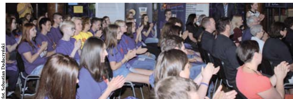
Jednym z flagowych projektów edukacyjnych powiatu jest Bolesławowo Business Week

REGION | Okazało się, że wieloletnie inwestowanie w edukację jest opłacalne, a świadczą o tym efekty. Szkoły ponadgimnazjalne w powiecie starogardzkim osiągnęły bardzo wysoką zdawalność egzaminów maturalnych. W tym roku zajęły wysokie, bo czwarte miejsce w województwie pomorskim, z czego cieszą się władze powiatu, które prowadzą powyższe placówki.