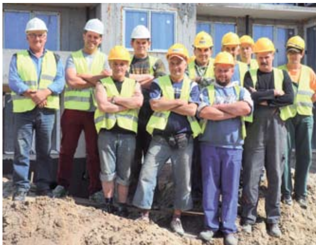
Kierownik sanitarny wraz z brygadą hydraulików

W firmie są oczywiście też panie. Kierownictwo Har-