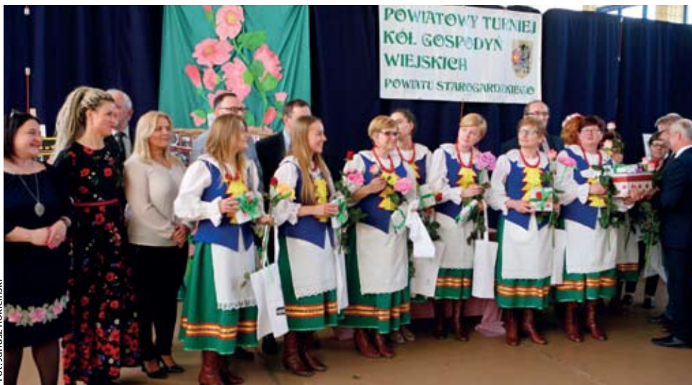
Fot. Janusz Rokiciński

■ SALĘ GIMNASTYCZNĄ W PSP JABŁOWIE WYPEŁNIŁA RADOŚĆ, SZTUKA I HUMOR ZA SPRAWĄ XV POWIATOWEGO TURNIEJU KÓŁ GOSPODYŃ WIEJSKICH, KTÓRE Z KÓŁ W TYM ROKU OKAZAŁO SIĘ NAJLEPSZE?