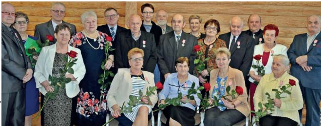
Gmina Starogard Gdański

W Grodzisku Owidz odbyła się uroczystość wręczenia „Medali za Długoletnie Pożycie Małżeńskie”.