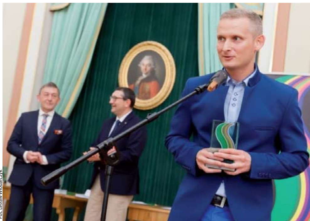
Fot. Lesław Włodarczyk

Ustawa o dostępie do informacji publicznej le-