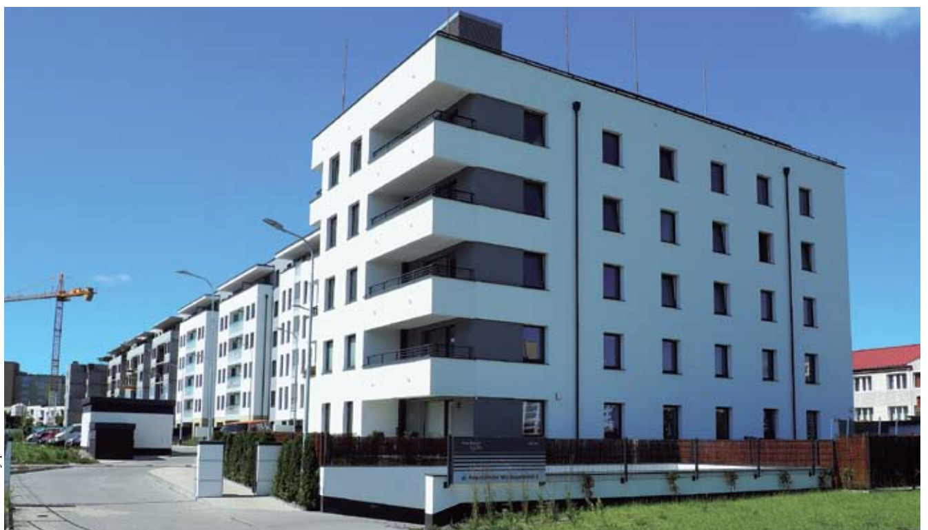
fol. Materiały prasowe

zapełnić portfel w miejsce segmentu zamówień sektora publicznego. Chcę także podkreślić, że ograniczenie robót w sektorze publicznym spowodowało, iż spółka bardziej odważnie weszła w sektor prywatny, co dało pozytywne efekty. Prezes ma jednak nadzieję, że spółka dalej będzie realizowała inwestycje w sektorze publicznym, gdy tylko zostaną uruchomione przetargi dofinansowane ze środków unijnych. Chodzi o nową perspektywę na lata 2014-2020. Do tej pory Hartuna bardzo często wykonywała dla samorządów oraz różnych innych instytucji m.in. budowy szkół, hal sportowych itd. Obecnie cały czas trwa budowa silnego zespołu pracowników. Firma poszukuje specjalistów, takich