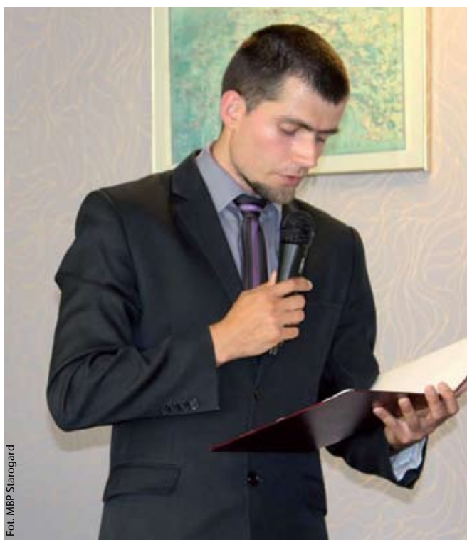
Fot. MBP Starogard