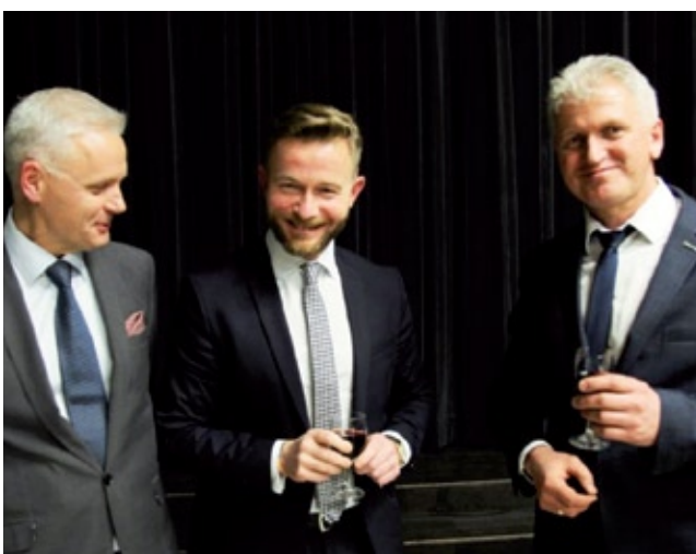
for: UM Starogard

- Był to rok wyjątkowy pod względem inwestycji. Gmina odnotowała w historii największy budżet - ponad dwustu milionowy. Z tego