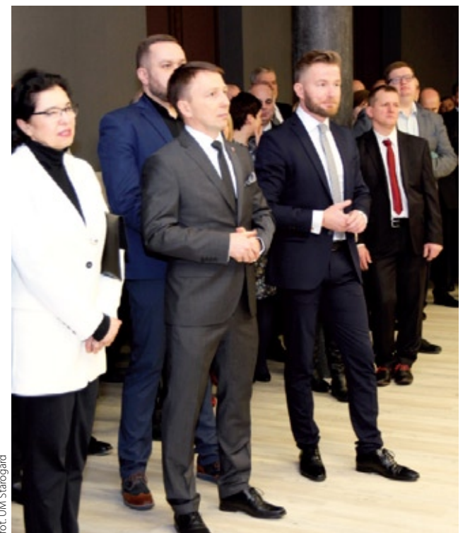
for: UM Starogard

Oficjalną część samorządowego spotkania noworocznego zakończono toastem za pomyślność roku 2018. Spotkanie uświetlił występ rodzinnego duetu pn. „Ollers trio”. (SG)