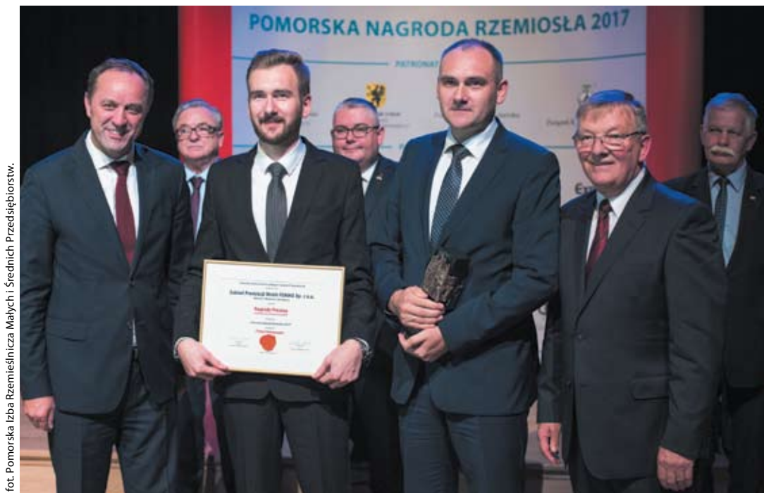
fol. Pomorska Izba Rzemieśnicza Małych i Średnich Przedsiębiorstw.

Producent mebli ze Skarszew został doceniony za nowoczesne rozwiązania, przedsiębiorstwo otrzymało nagrodę Prezesa Pomorskiej Izby Rzemieśniczej MSP w kategorii Firma Innowacyjna.