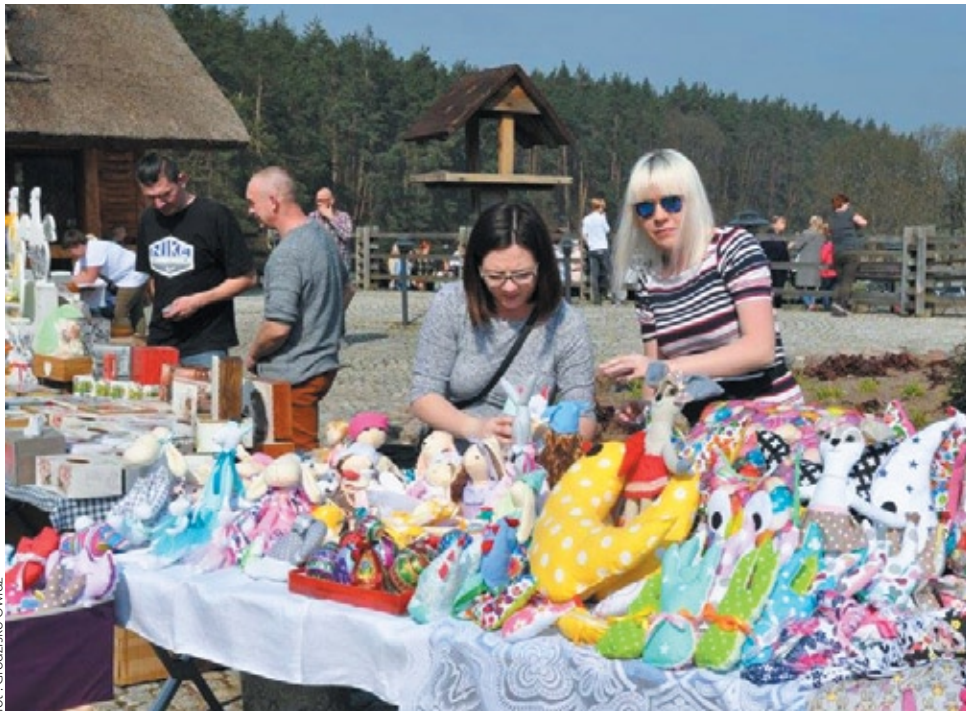
fol. - Grodzisko Owidz