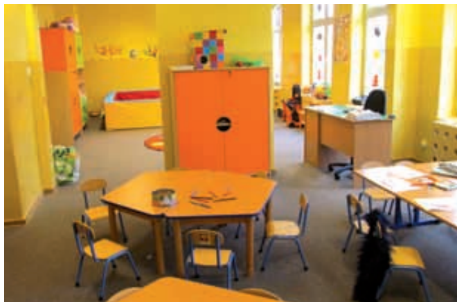
Punkt Przedszkolny w Mierzeszynie