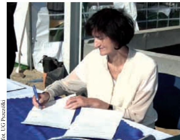
fol. UG Pszczółki

Wmurowanie kamienia węgielnego pod budowę Ośrodka Doskonalenia Techniki Jazdy odbyło się w Pszczółkach.