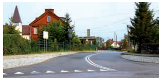
Droga Ełganowo-Trąbki Wielkie

Warcz i Zaskoczynie powstały place zabaw. Zmodernizowano boiska w Czerniewie, Gołębiewie Wielkim, Kłodawie i Łąguszewie. W Gołębiewie Wielkim, Sobowidzu i Trąbkach Wielkich wykonano parki fitness i zakupiono mobilną ściankę wspinaczkową. W centrum miejscowości Trąbki Małe i Trąbki Wielkie powstały tereny rekreacyjne. Wykonano pętle rowerowe indukcyjne w Postołowie i Sobowidzu. Na terenie gminy zamontowano stojaki do rowerów.