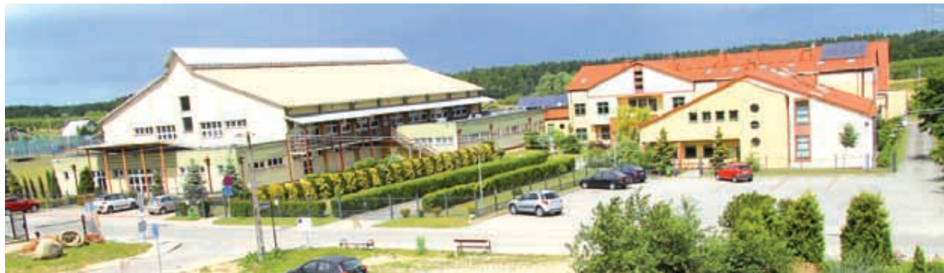
Gimnazjum im. Kazimierza Jagiellończyka w Trąbkach Wielkich