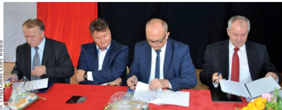
fol. Urząd Gminy Cedry Wielkie

- Wójt Gminy Trąbki Wielkie, a także przedstawiciele szkół i ośrodków kultury z terenu gmin objętych współpracą. Podpisanie listu intencyjnego skierowane jest na współpracę,