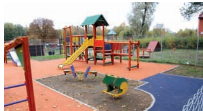
Plac zabaw Kłodawa