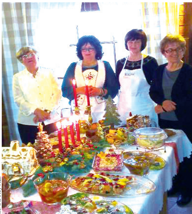
fol. UG Przywidz

Prężnie działa również Uniwersytet III Wieku S.O.S. Przy-