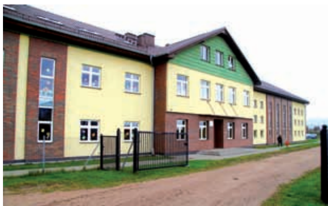
Zespół Szkół w Mierzeszynie

W minionym okresie zostały zakończone prace związane z budową szkoły w Mierzeszynie oraz powstała sala gimnastyczna. W ramach Rządowego Programu „Radosna Szkoła” we wszystkich Szkołach Podstawowych na terenie gminy powstały szkolne place zabaw dla dzieci. Dodatkowo Szkoła Podstawowa im. Zygmunta Bukowskiego w Czerniewie w ramach projektu „Cyfrowa Szkoła” zakupiła sprzęt komputerowy o łącznej wartości 108,9 tys. zł. W szkole są prowadzone zajęcia lekcyjne z wykorzystaniem zakupionego sprzętu. Obiekty szkolne na terenie gminy są stale modernizowane i unowocześniane. Na wszystkich zostały zamontowane solary do podgrzewania wody. W szkole w Sobowidzu wymieniono piec grzewczy i wybudowano zbiornik na nieczystości oraz opracowano dokumentację termomodernizacji ścian i budowy przyшкольного boiska typu „Orlik”. W szkołach w Mierzeszynie i Sobowidzu przystosowano pomieszczenia do utworzenia punktów przedszkolnych. Od 30 września br. do punktów przedszkolnych uczęszczają dzieci z terenu gminy. Przy szkole w Trąbkach Wielkich utwardzono plac i wymieniono piec w kotłowni ogrzewającej ten obiekt. Wykonano parking przy przedszkolu w Trąbkach Wielkich. Został opracowany projekt rozbudowy szkoły w Trąbkach Wielkich oraz dokumentacja na budowę sali gimnastycznej przy szkole w Kłodawie. Wykonano projekt budowy przyłączy gazowych do wszystkich obiektów oświatowych w Trąbkach Wielkich. Dzieci do szkół dowożone są głównie gminnymi autobusami, które gmina sukcesywnie