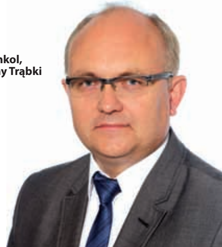
Mat. UG Trąbki Wielkie

wraz z punktem widokowym. Został wykonany remont świetlicy wiejskiej w Kleszczewie i Mierzeszynie, dobiega końca remont świetlicy w Łąguszewie. Wybudowano nowe świetlice wiejskie w Domachowie i Pawłowie. Opracowano projekty rozbudowy świetlic w Cząstkowie, Gołębiewie Średnim i Złej Wsi oraz budowy świetlicy w Postołowie. Powstały wiaty festynowe w Drzewinie i Granicznej Wsi. W miejscowości Drzewina, Graniczna Wieś, Kaczki, Kłodawa,