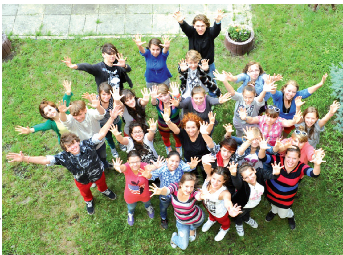
W Kolbudach dzieje się wiele ciekawych inicjatyw

W ciągu ostatnich lat na terenie gminy Kolbudy zmieniło się wiele. Docenili to autorzy raportu podsumowującego kończącą się kadencję samorządu. Wśród gmin o charakterze przemysłowo-usługowym gmina Kolbudy zajęła 4. miejsce w Polsce.